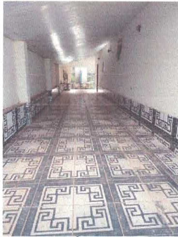
Imagem 02 – Área de lazer lateral