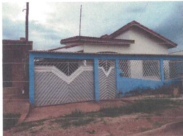
Imagem 01 – Vista Frontal

Luana Máximo Prefeitura Mun De Anapú Engenheira Civil RNP 1558638255