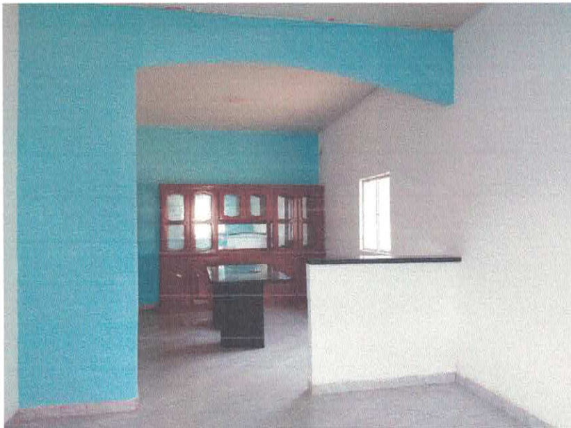
Imagem 03 – Sala de estar e jantar conjugada

Prefeitura Mun De Anapú Juana Máximo Engenheira Civil RNP 1456838256