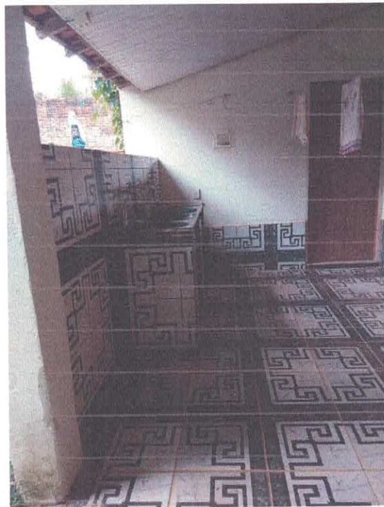
Imagem 05 – Área de Serviço

Prefeitura Municipal de Anapú Luana Máximo Engenheira Civil RNP 1350838266