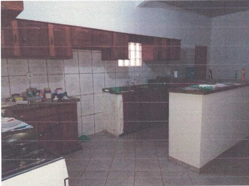
Imagem 04 – Cozinnha