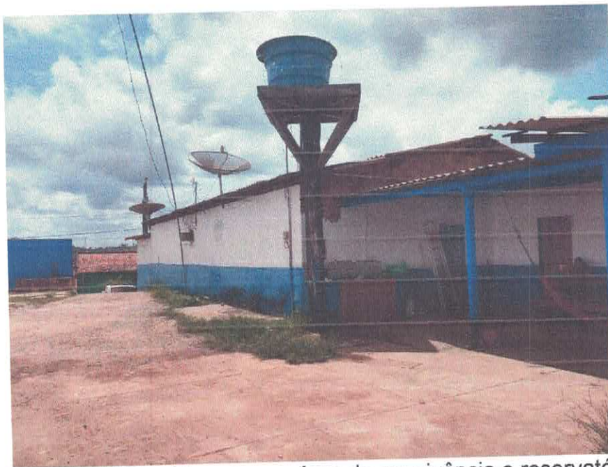
Imagem 03 – Vista pátio externo, área de convivência e reservatório elevado.