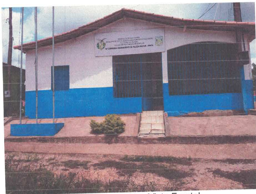
Imagem 01 – Vista Frontal