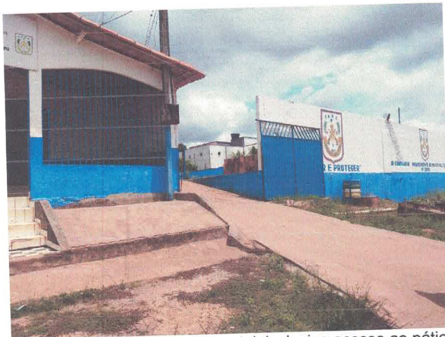
Imagem 02 – Vista Frontal, inclusive acesso ao pátio

Luane Prefeitura Mun De Anapú Luana Máximo Engenheira Civil RNP 1356638256