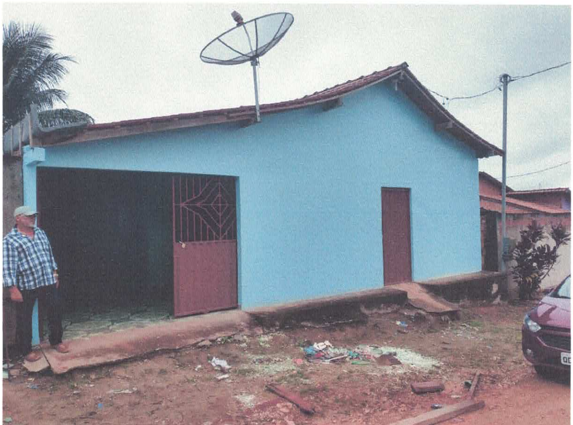
Imagem 01 – Vista Frontal

Luana Prefeitura Mun. de Anapú Luana Máximo Engenheira Civil RNP: 1518638255