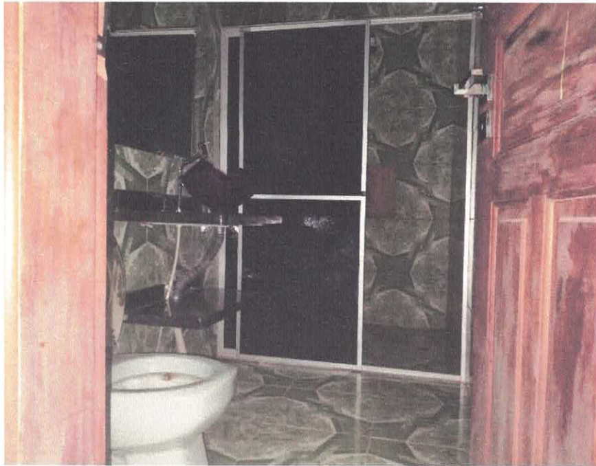
Imagem 08 – Banheiro 1