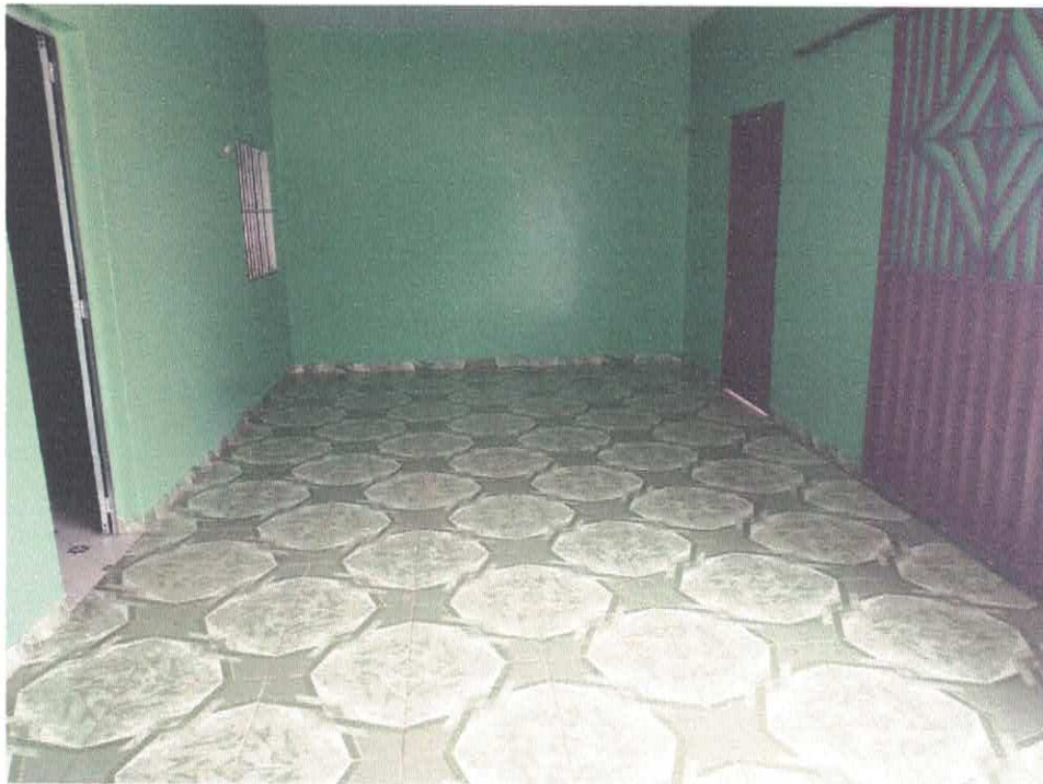
Imagem 03 – Área