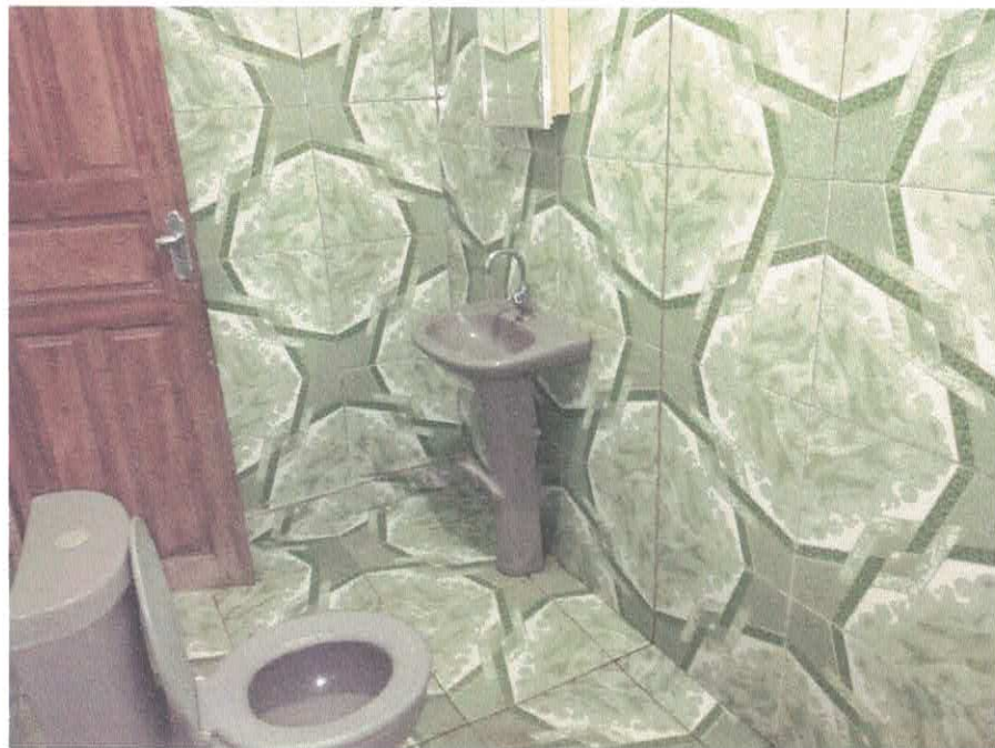
Imagem 09 - Banheiro