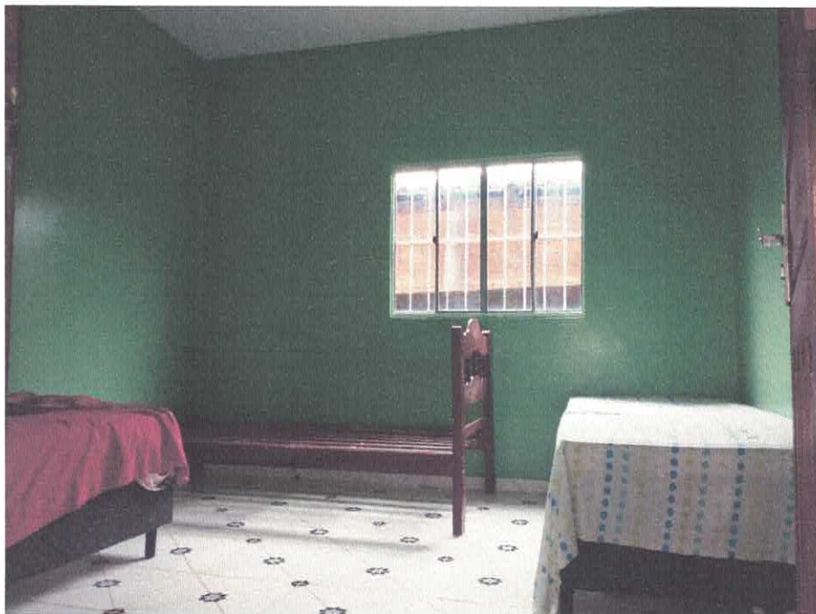
Imagem 07 – Quarto 2

Juana Prefeitura Mun. de Anapú Luaha Máximo Engenheira Civil RNP: 1516638255