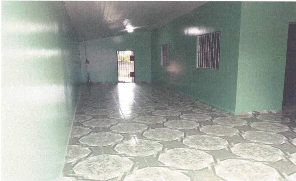
Imagem 02 – Área