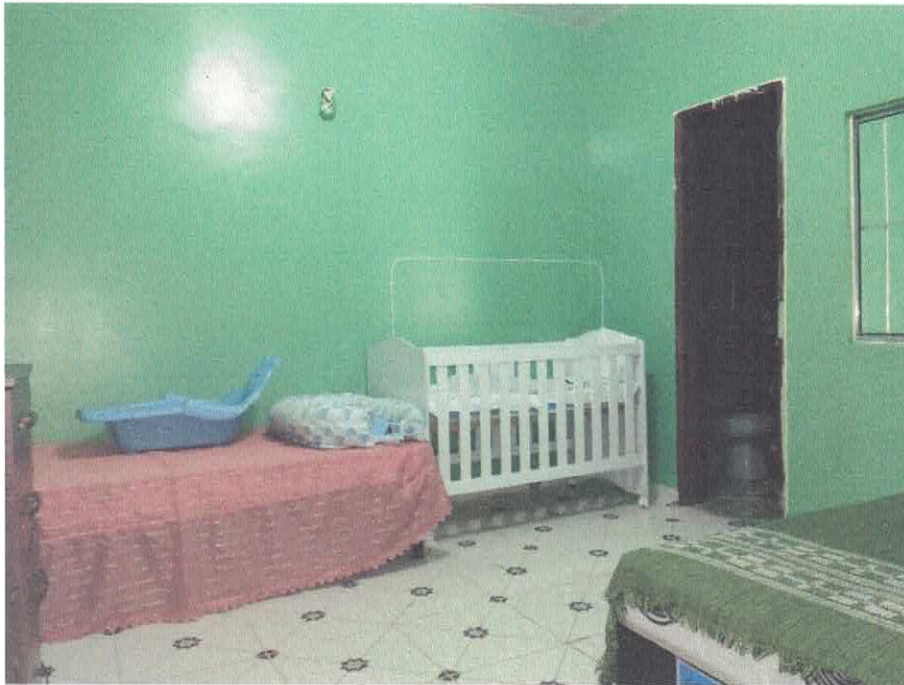
Imagem 06 – Quarto 1