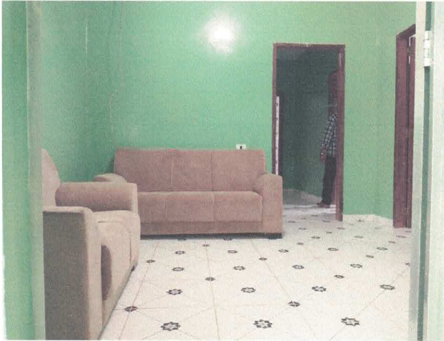
Imagem 04 – Sala 1