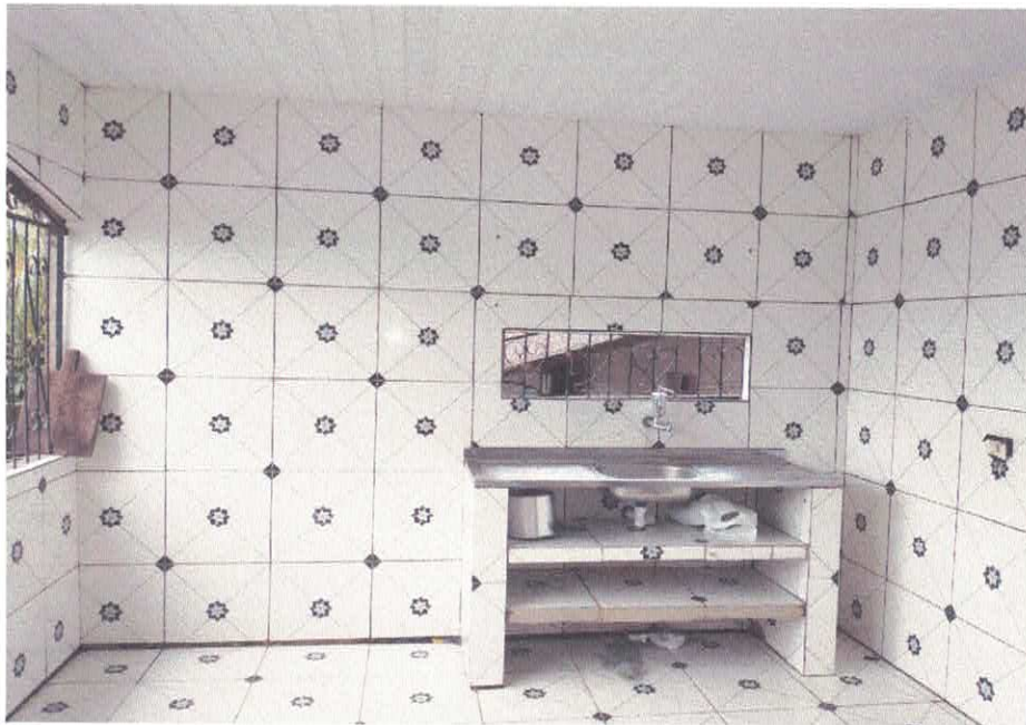
Imagem 10 – Cozinha