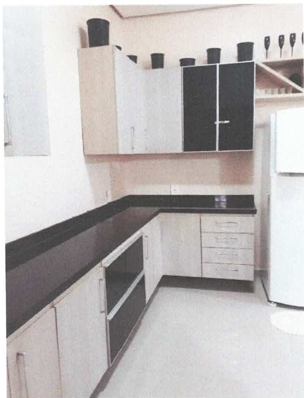
Figura 6 - Cozinha