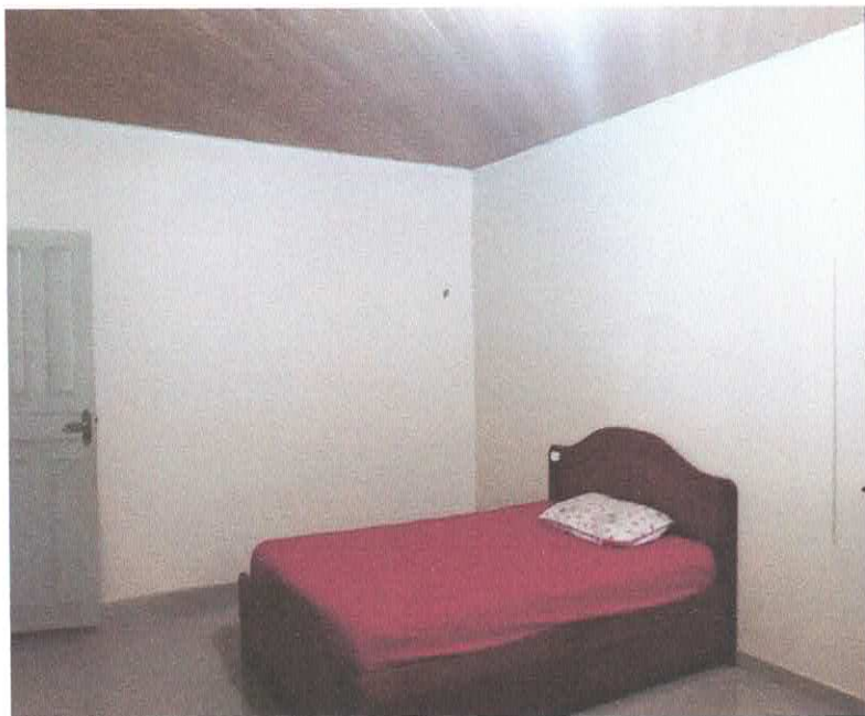
Figura 4 - Quarto 01