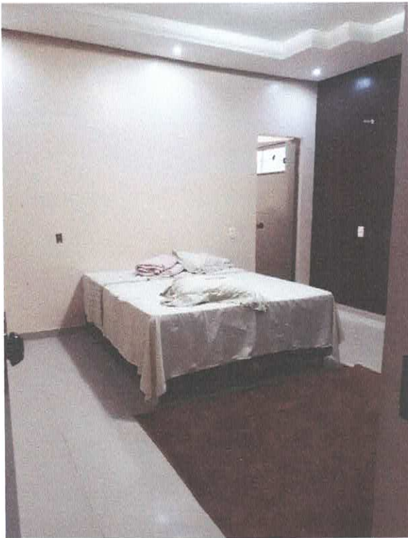
Figura 2 - Suíte Principal