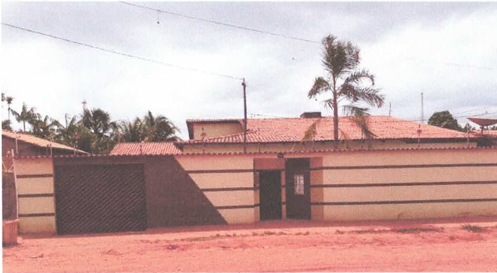
Figura 1 - Fachada