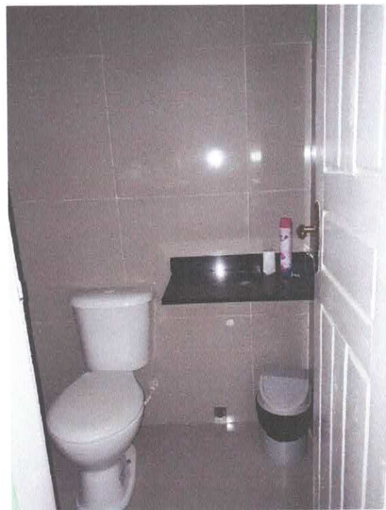
Figura 9 - Wc Suíte

Declaramos sob a pena da lei, que o imóvel descrito em conformidade com o LAUDO acima, atende as condições abaixo: