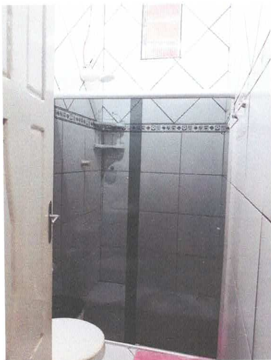
Figura 8 - Wc social