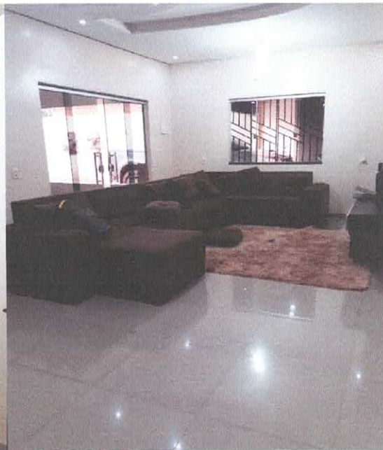
Figura 5 - Sala