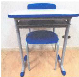
CJA 06 (ABS)