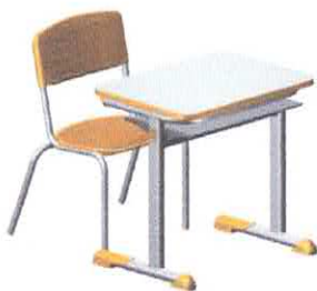
CJA 01 (ABS)