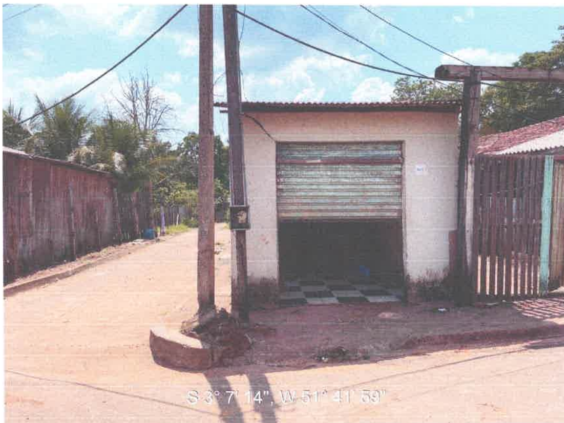
FOTO 1 - VISTA FRONTAL