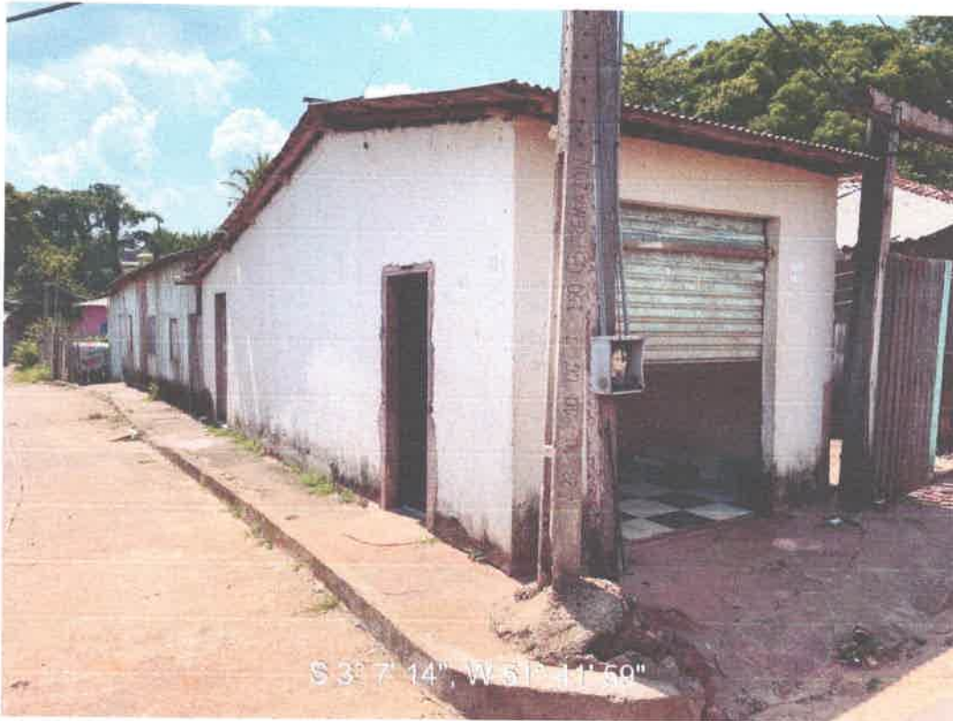
FOTO 2 - VISTA LATERAL