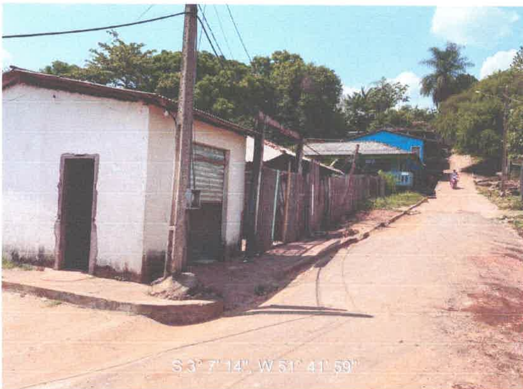
FOTO 3 - VISTA EXTERNA - ACESSO RUA